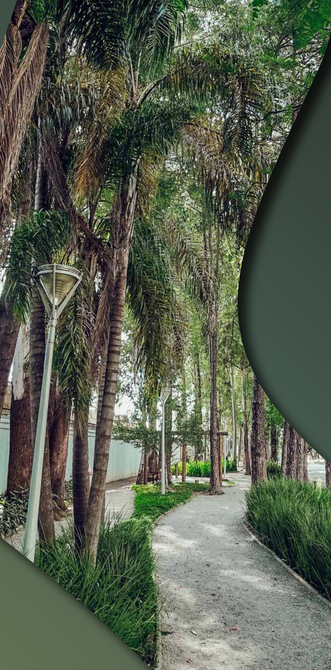
Foto da região