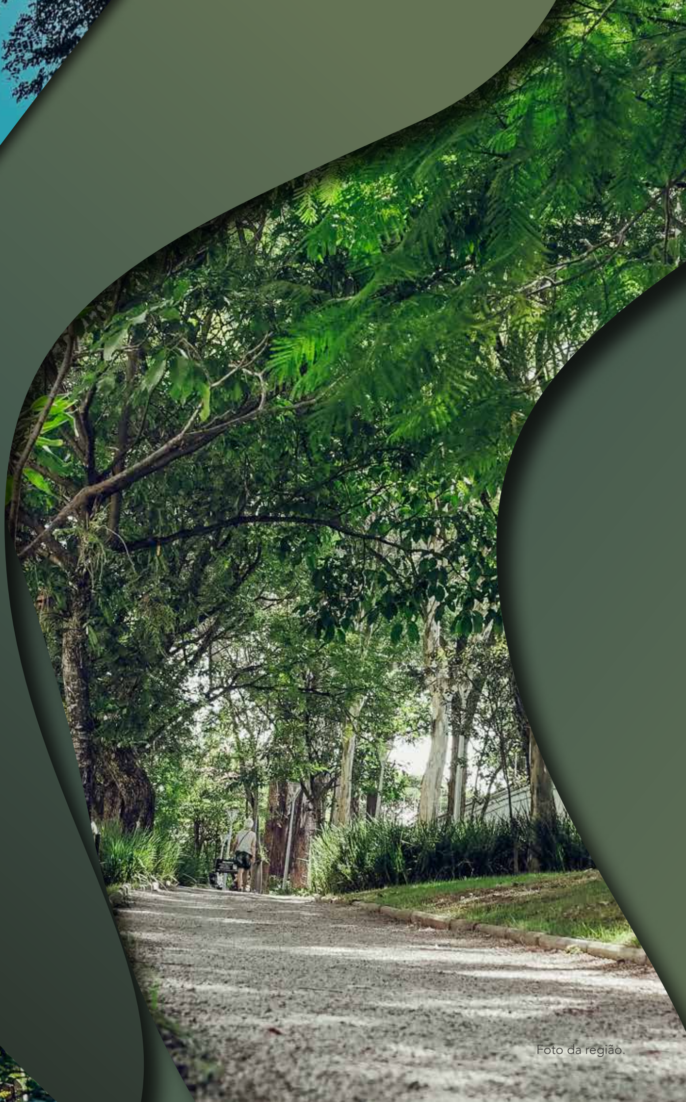
Foto da região